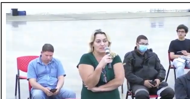
Participação dos municípios