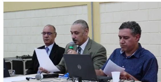
Consultoria respondendo às demandas dos municípios