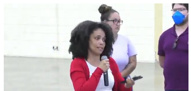
Participação dos municípios